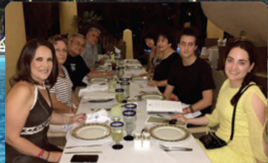
GANADORES AVENTURA 2017

El pasado mes de Noviembre se llevó a cabo nuestro Viaje de Celebración: Aventura Los Cabos 2017, donde Distribuidores y Embajadores con sus acompañantes disfrutaron de las hermosas playas de Los Cabos así como de las amenidades y comodidades que ofreció el Hotel Riu Santa Fe.